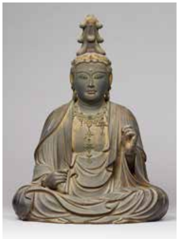
奈良県指定文化財 文殊菩薩騎獅像 鎌倉時代 法華寺