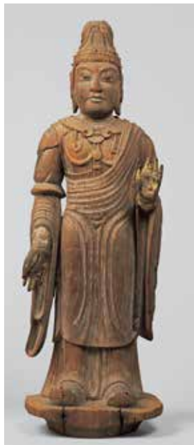
天部形立像(伝帝釈天) 平安時代 唐招提寺

日時:10月12日(土) ①10:30~ ②13:30~ 展覧会見学も含め1時間30分程度 会場:体験学習室 対象:小学校3年生以上(小学生の方は保護者同伴) 定員:各回4組(事前申込が必要、定員になり次第終了) 申込先:山梨県立博物館 電話:055(261)2631 ※参加無料、9/14(土)より申込受付開始