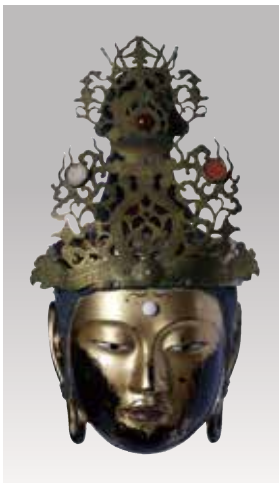
奈良県指定文化財 菩薩面(来迎会所用面) 室町時代 當麻寺