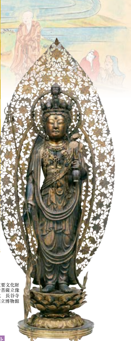
重要文化財 十一面観音菩薩立像 鎌倉時代 長谷寺

Masterpieces of Buddhist Statue in NARA: Pilgrimages to the Ancient Temples