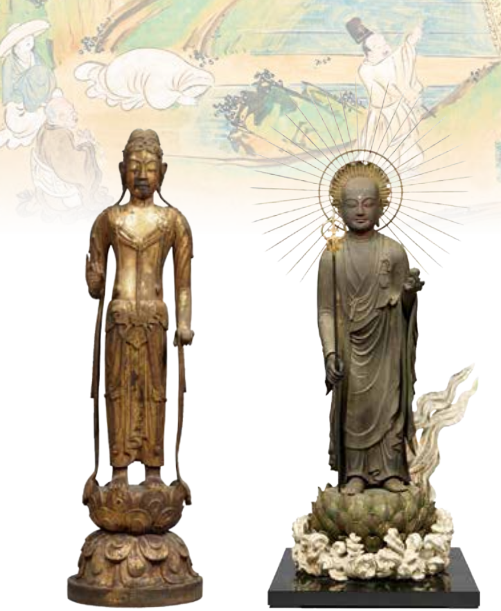
重要文化財 普賢菩薩立像(六観音のうち) 飛鳥時代 法隆寺